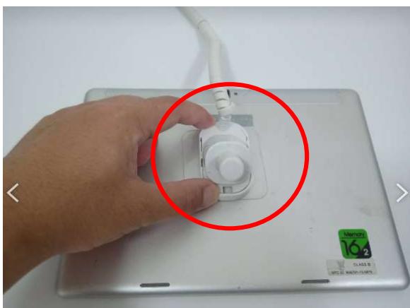
ต้องการวางจอในแนวนอน

*** ขั้นตอนนี้ทดลองวางตำแหน่งที่ต้องการก่อนนะครับ ว่าติดจอแนวนอนติดอย่างไร ติดจอแนวตั้งติดอย่างไร ถ้าติดกับแผ่นกาวนาโนแล้ว แกะออกยากมากครับ