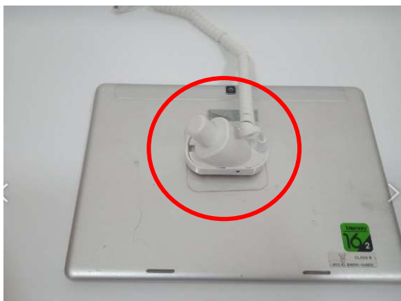
ต้องการวางจอในแนวตั้ง

ขั้นตอนที่ 3 : เก็บสายไฟ ให้เรียบร้อย และแกะกาว 3 M ออก